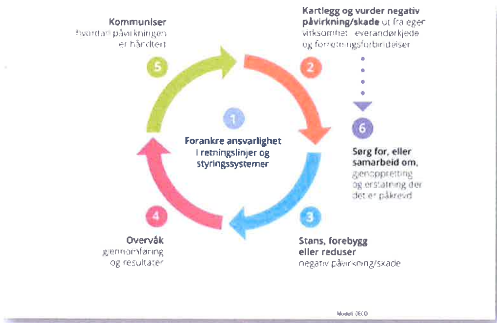
Figur 1: OECD's aktsomhetshjul for ansvarlig næringsliv

Aktsomhetsstandarden i åpenhetsloven bygger på FNs retningsgivende prinsipper for ansvarlig næringsliv og menneskerettigheter og OECD sin veileder for aktsomhetsvurderinger for ansvarlig næringsliv: